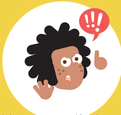
Ik kan voor mezelf opkomen