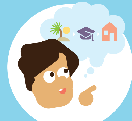
Ik kan plannen maken