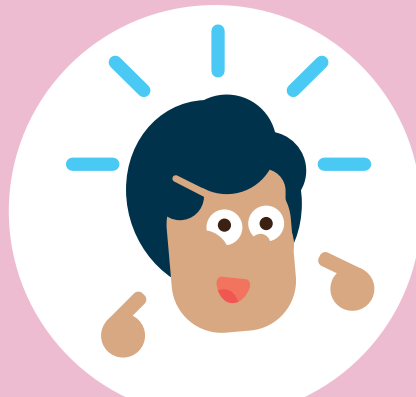
Ik heb zelfvertrouwen