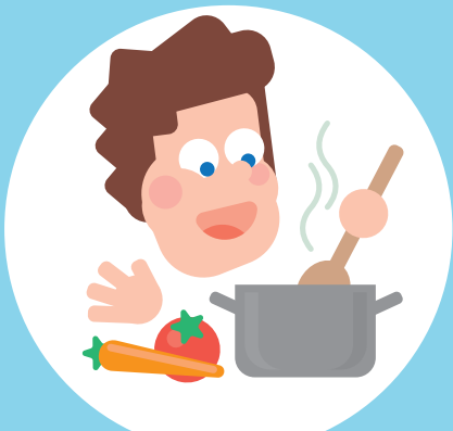
Ik ben zelfstandig