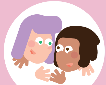
Ik kan knuffelen