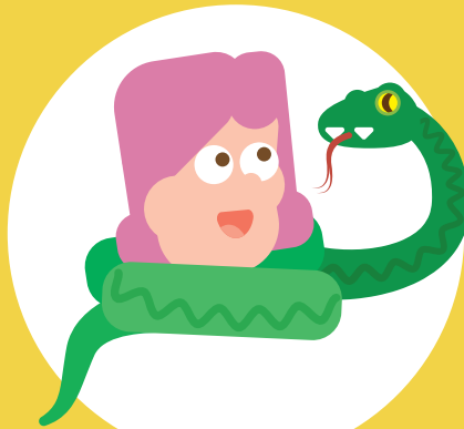
Ik heb lef