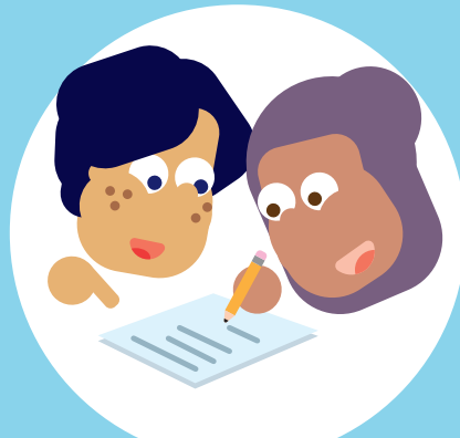
Ik kan samenwerken