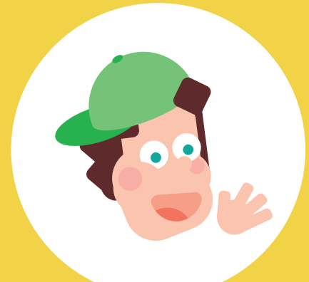
Ik ben vrolijk