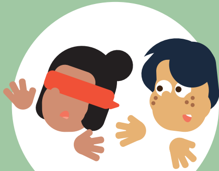
Je kan op mij rekenen