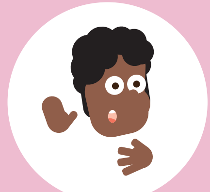
Ik ben eerlijk