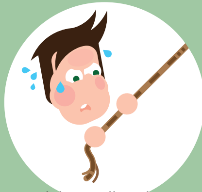
Ik kan volhouden