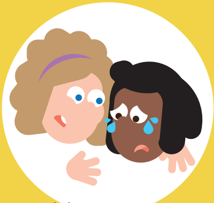
Ik kan troosten