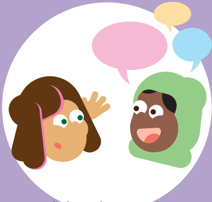
Ik kan luisteren